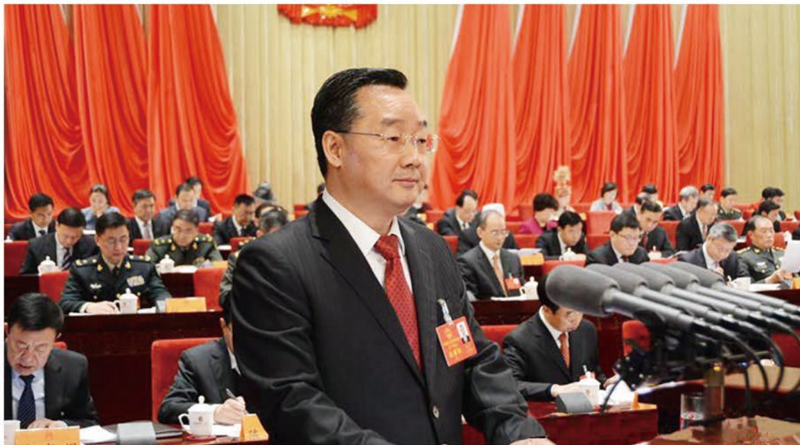
省委副书记、省长唐仁健作甘肃省政府工作报告

在甘肃省第十三届人民代表大会第一次会议上所作的政府工作报告中，将“全省农村妇女开展‘两癌’免费检查”列入2018年为民办实事项目之一。项目计划2018-2020年为全省35至64岁的农村妇女进行“两癌”免费检查，其中，2018年完成目标人群的25%，2019年完成目标人群的35%，2020年完成目标人群的20%。通过“两癌”检查，做到“早预防、早发现、早诊断、早治疗”，达到2020年两纲、两规划“妇女常见病定期筛查率达到80%以上”和“提高宫颈癌和乳腺癌的早诊早治率，降低死亡率”的目标要求，不断提高全省广大农村妇女防病意识和健康水平，有效降低农村妇女因病致贫、因病返贫的风险，从根本上解决妇女“两癌”发病率高的问题。