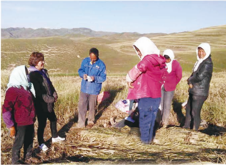
古浪县黑松镇磨河湾村积极发展畜牧养殖技术，走上了产业脱贫的路子