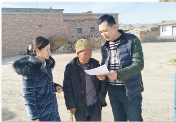
靖远县永新乡妇联干部入户走访贫困户