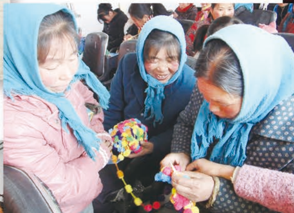
一双巧手编织幸福生活