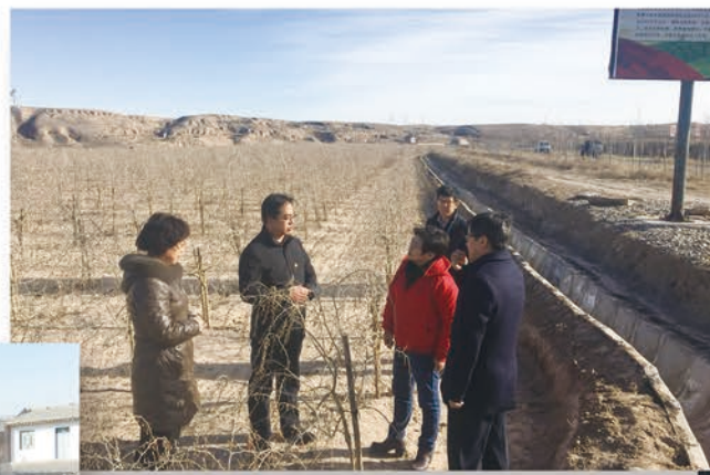
省委农工办主任、省妇联兼职副主席李秀娟调研靖远永新乡扶贫攻坚工作