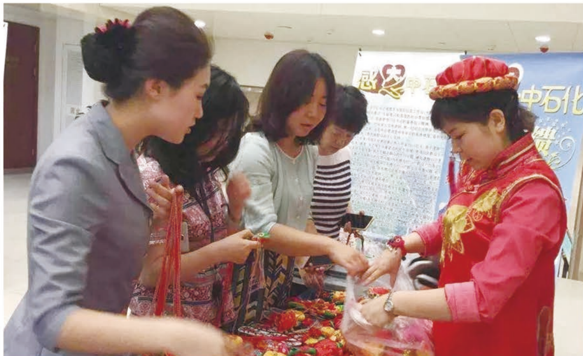
东乡县妇女打造出了手工制品新品牌

为了让贫困妇女掌握的巧手技艺转化为脱贫致富的稳定收入来源，让东乡族精美的手工制品走出大山，走进市场，产生最大经济效益，我们组织100多个陇原巧手能手，前往浙江、江苏、福建、陕西等地，深入考察学习刺绣、串珠工艺品、手工拖鞋等现代手工技法。及时申请注册了“布楞沟”手工制品商标，积极组织陇原巧手经纪人参加各种大型展销会、博览会，开设东乡族陇原巧手展厅，展出各类优秀的民族民俗产品。在中石化总部进行义卖，大力推介东乡族“布楞沟”系列产品，共帮助妇女销售产品5万余件，实现收入180万元，不仅拓宽了销售渠道，打响了陇原巧手民族制品的知名度，进一步激发了广大妇女参与技能培训的热情和活力。2015年，东乡手工布鞋获得国际民族用品博览会银奖；2016年，“布楞沟”方枕获得临