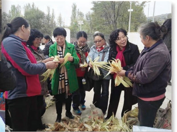
省妇联扶贫帮扶工作在漳县盐井镇的三个帮扶村开展编织技能培训