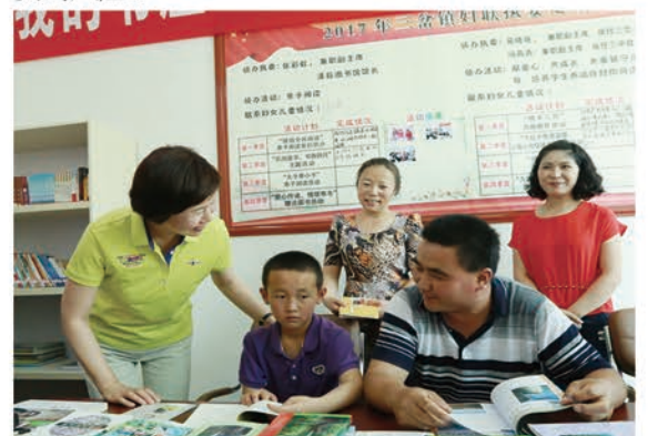
省妇联党组书记、主席周丽宁赴漳县调研脱贫攻坚工作

三是促进抓实见效。在省妇联十三届八次执委扩大会议上，我们对今年的妇女脱贫工作进行了安排部署，各级妇联要早谋划、早部署、早行动，采取有力措施狠抓“巾帼脱贫行动”落实，有力有效地完成既定的各项妇女脱贫任务。宣传励志行动要聚焦政策引导、教育引导、典型引导，注重扶贫与扶志扶智结合，大力开展“陇原女面对面”、美丽庭院创建等活动，在切实解决安于现状、等着别人送小康等脱贫内生动力不足的问题上下功夫，补齐贫困妇女“精神短板”。骨干培训行动要聚焦种植养殖女能手，新型农业经营主体和服务主体女性创办领办人，巾帼脱贫与妇女双创示范基地负责人，农业、陇原妹及陇原巧手经纪人等重点人群，大力开展培训，努力培养扶持一支示范带动作用明显的骨干力量。家政就业行动要聚焦有条件有意愿走出去的贫困妇女，面对面地宣传动员，手把手地对比算账，切实转变家政服务低人一等的错误观念，帮助1.9万妇女在家政领域稳定就业。巧手编织行动要聚焦产品创意设计与市场销售两个关键环节，大力扶持并牢牢抓住10个巧手双创基地，抱团发展、扩大规模，注重文化内涵、打好文化品牌，在延伸产业链、形成独特产业优势、对接生产基地、带动贫困妇女增收上取得突破。产业富民行动要聚焦特色优势产业，加大妇女创业担保贷款政策落实力度，扩大受益覆盖面，引领带动贫困妇女发展庭院经济、休闲农业、家庭农场、农家乐、乡村旅游和电子商务等新业态。健康关爱行动要聚焦“两癌”贫困妇女，争取将“两癌”贫困妇女检查纳入省政府2018年为民办实事项目，为全省农村妇女提供免费检查，以“早预防、早发现、早诊断、早治疗”，有效降低农村妇女因病致贫、因病返贫的风险。