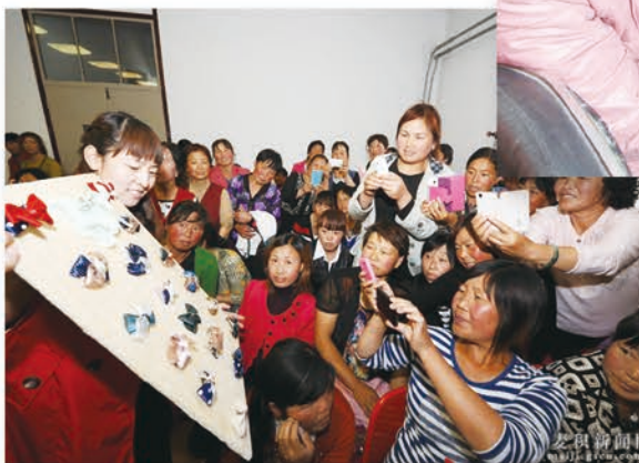
麦积区妇女积极学习提高手工技艺