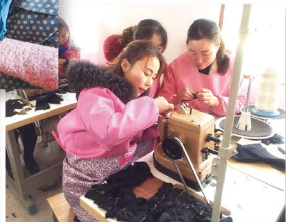
西和县妇女积极发展指尖经济，实现居家灵活就业