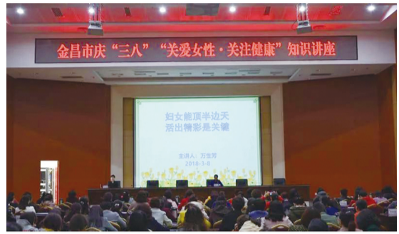
金昌市庆“三八”“关爱女性·关注健康”知识讲座