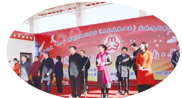
武威市举办《反家庭暴力法》实施两周年宣传活动启动仪式

新时代、新气象、新作为。在省妇联的部署安排下，全省各级妇联坚持庆祝活动面向基层、把活动开展到群众身边，从省城兰州到大漠敦煌，从陇东高原到千里河西走廊，各地、各级妇联以一场场异彩纷呈的活动庆祝了这个盛大节日，充分体现了开展基层妇联组织改革以来妇联工作的勃勃生机。