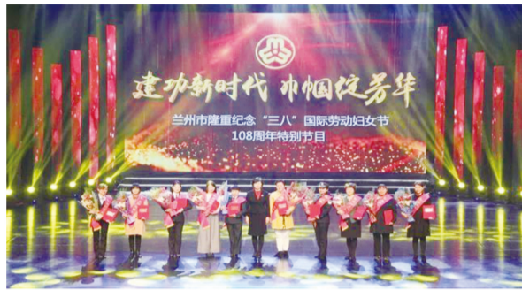
兰州市举办“三八”国际劳动妇女节108周年大型纪念活动