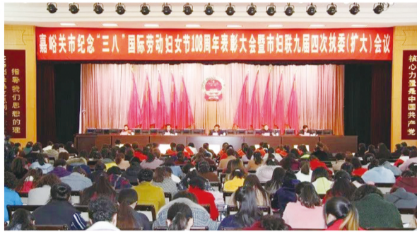
嘉峪关市举办表彰大会暨市妇联九届四次执委(扩大)会议