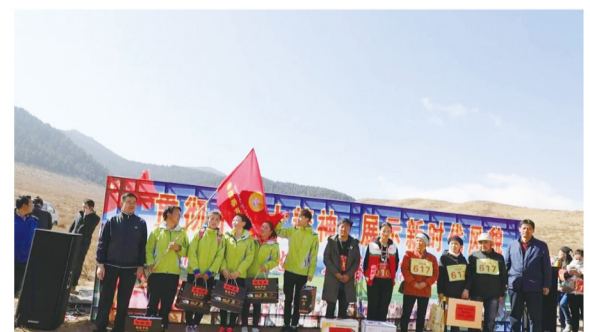
甘南州举办全民登高喜迎“三八”