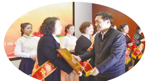
陇南市举办“三八”国际劳动妇女节108周年颁奖典礼暨专题文艺演出