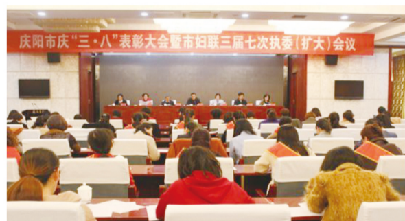
庆阳市举办庆“三八”表彰大会暨市妇联三届七次执委(扩大)会议