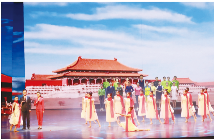
情景诗画《唱支山歌给党听》