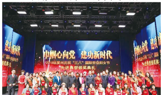
临夏州庆祝“三八”国际劳动妇女节先进典型颁奖典礼