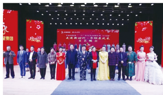
平凉市举办纪念“三八”108周年暨“巨星杯”“走进新时代·巾帼展风采”文艺演出