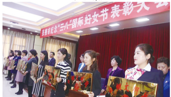
张掖市举办纪念“三八”国际妇女节表彰大会