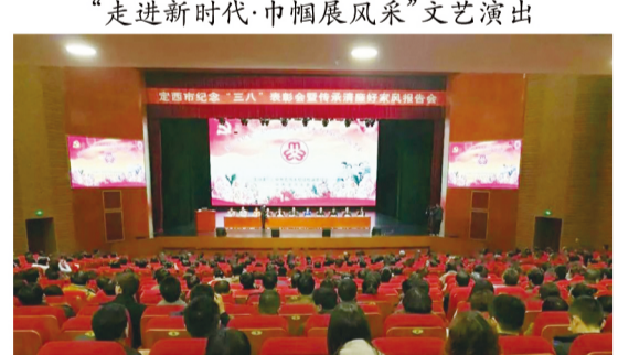
定西市举办纪念“三八”国际劳动妇女节108周年表彰大会