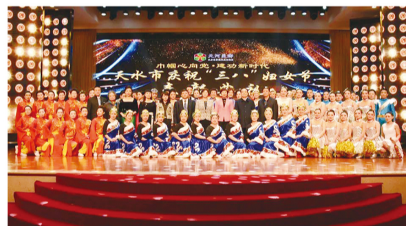
天水市举办庆祝“三八”国际妇女节表彰典礼