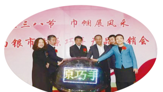
白银市举办“喜迎三八·巾帼展风采”首届白银市陇原巧手产品展销会

新时代、新气象、新作为。在省妇联的部署安排下，全省各级妇联坚持庆祝活动面向基层、把活动开展到群众身边，从省城兰州到大漠敦煌，从陇东高原到千里河西走廊，各地、各级妇联以一场场异彩纷呈的活动庆祝了这个盛大节日，充分体现了开展基层妇联组织改革以来妇联工作的勃勃生机。